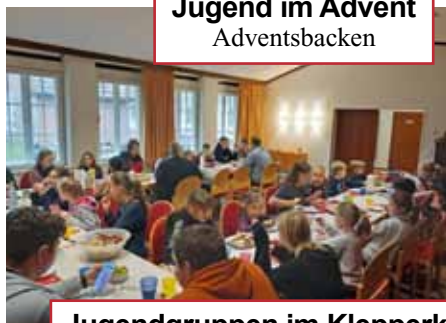
Jugend im Advent Adventsbacken