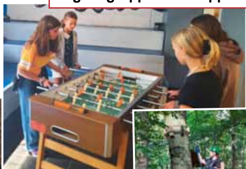
Jugendgruppen im Klepperkeller