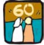
Silberne / Diamantene Hochzeit